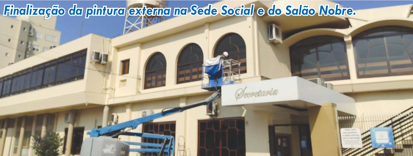
Finalização da pintura externa na Sede Social e do Salão Nobre.